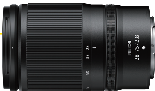
NIKKOR Z 28-75mm f/2.8