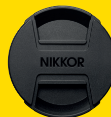
TAPPO OBIETTIVO ANTERIORE LC-67B