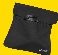
CUSTODIA OBIETTIVO CL-C2