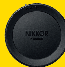
TAPPO OBIETTIVO POSTERIORE LF-N1